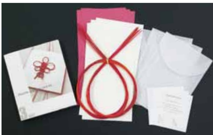
グリーティングカード完成例